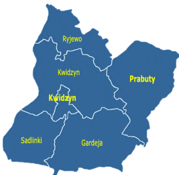
Rysunek 3 Położenie Gminy Ryjewo na tle Powiatu Kwidzyńskiego

Przez teren gminy przebiega trasa rowerowa "Doliną Dolnej Wisły" i "Szlak Kopernikowski" biegnący z Grudziądza do Olsztyna. Przy drodze w kierunku Sztumu wije się wzdłuż strumieni uchodzących do zbiornika wodnego malownicza ścieżka spacerowa. Na terenie Gminy znajdują się liczne gospodarstwa agroturystyczne, położone w atrakcyjnych miejscach z wieloma atrakcjami i ciekawymi propozycjami na spędzenie wolnego czasu.