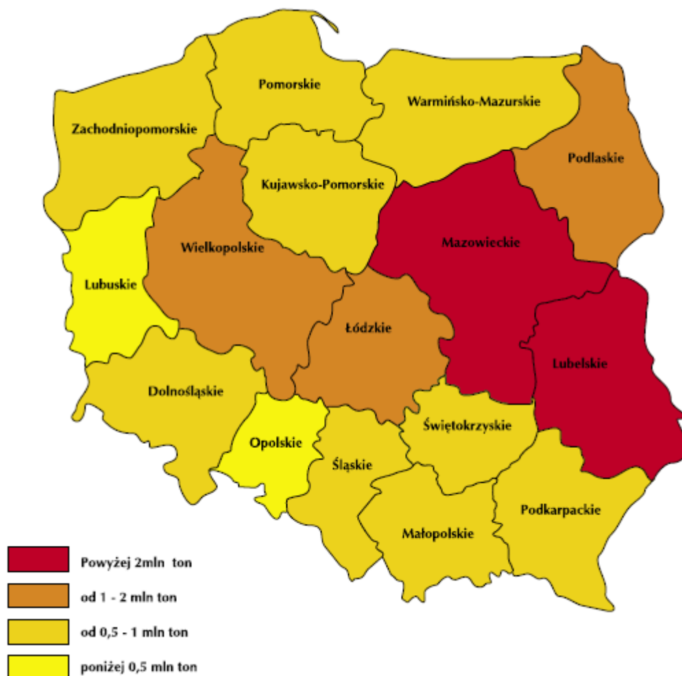
Rysunek 2 Rozmieszczenie wyrobów azbestowych na terenie kraju w układzie wojewódzkim (źródło: Program usuwania azbestu i wyrobów zawierających azbest stosowanych na terytorium Polski, RM RP Warszawa, 2002)

natomiast pozostała ilość należy do osób prawnych (m.in. spółdzielnie mieszkaniowe, jednostki samorządu terytorialnego). Pomorskie jest województwem w którym występują duże ilości wyrobów azbestowych i według szacunków ilość wyrobów azbestowych kształtuje się w przedziale pomiędzy 0,5-1 mln ton.