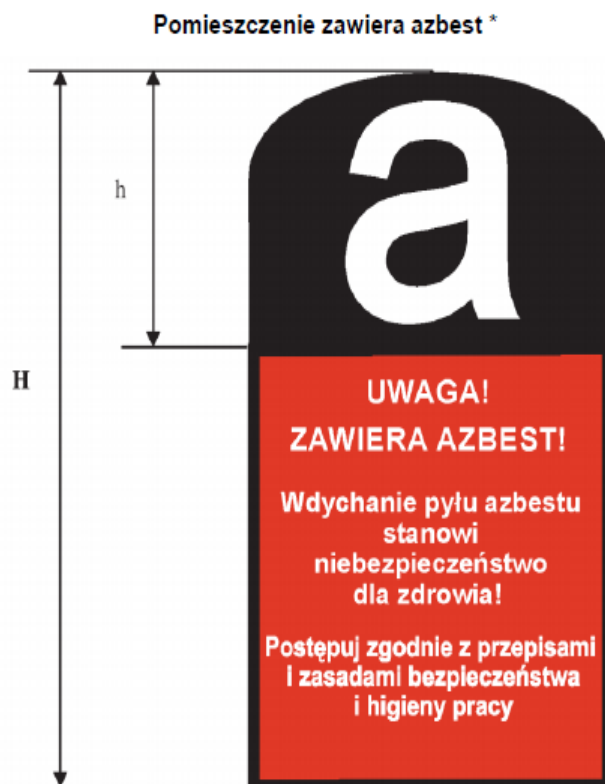
Rysunek 1 Graficzny wzór oznakowania azbestu i wyrobów zawierających azbest

Prace związane z usuwaniem wyrobów zawierających azbest prowadzi się w sposób uniemożliwiający emisję azbestu do środowiska oraz powodujący zminimalizowanie pylenia poprzez: